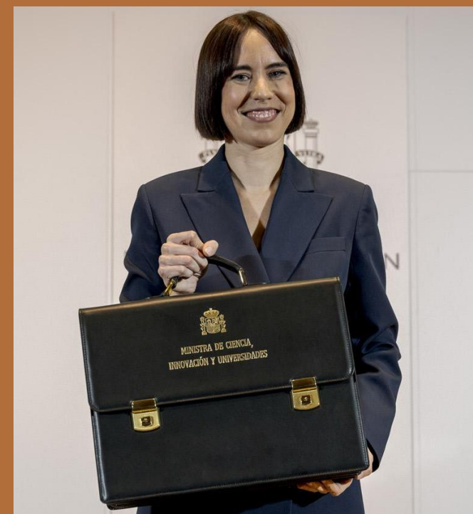
Diana Morant. Ministra de Ciencia, Innovación y Universidades